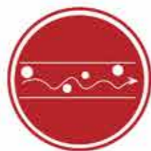
Lubrificazione Aria /Olio