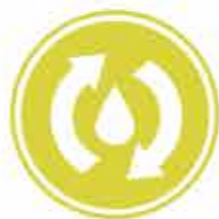
Lubrificazione Ricircolo Olio