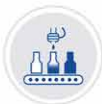
MACCHINE PER RIEMPIMENTO E LAVAGGIO